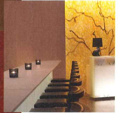
Слева и сверху: ресторан miX отеля W St. Petersburg